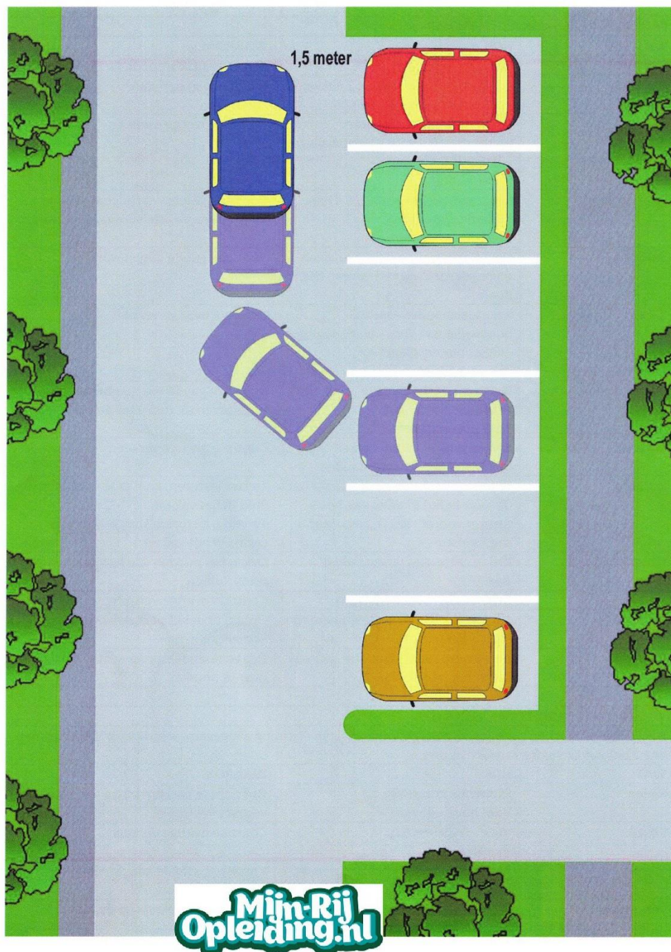
Afbeelding: Parkeren in een vak achterwaarts